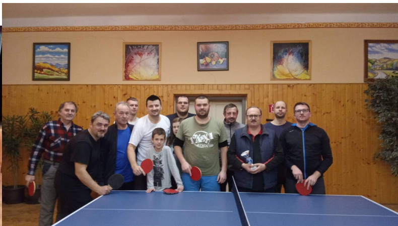
Stretnutie Jednoty dôchodcov Lúka a Modrovka