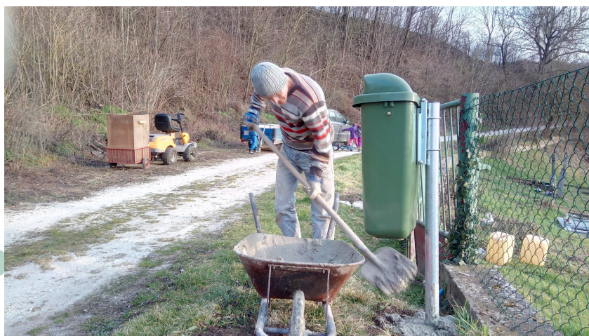
Inštalácia smetných košov na Modrovke /5 kusov/

Výborná akcia pod taktovkou organizácie Jednoty dôchodcov - občerstvenie, zábava, rozhovory, tanec, spev - výborne. Ďakujeme Jednote dôchodcov za svoje aktivity aj pre našich seniorov.