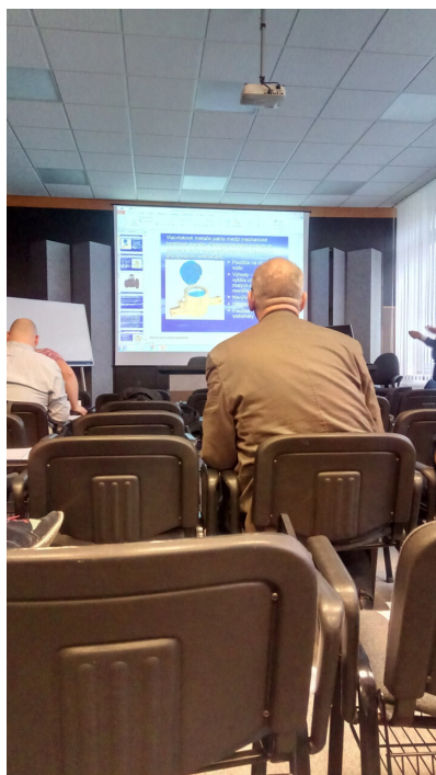
Foto zo školenia montáže vodomeroov a pracovného výjazdu v Slovenskom metrologickom ústave