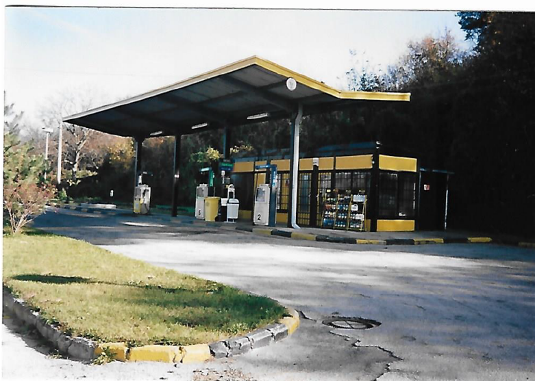
spracovala pani Okrucká - kronikárka obce Modrovka

Tak – trošku sme si zaspomínali na našu Modrovka v dávnejších časoch. A mnohým z nás sa akosi automaticky vybaví pocit radosti, veselosti a ... akejsi istoty? Je to len nostalgia?